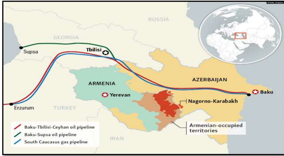
شكل (2): مسارات انابيب النفط والغاز التي تمر عبر أذربيجان